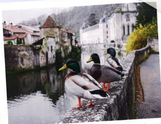
Les colverts de Brantôme prennent plaisir à batifoler autour du canal circulaire.