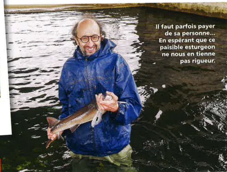
Il faut parfois payer de sa personne... En espérant que ce paisible esturgeon ne nous en tienne pas rigueur.